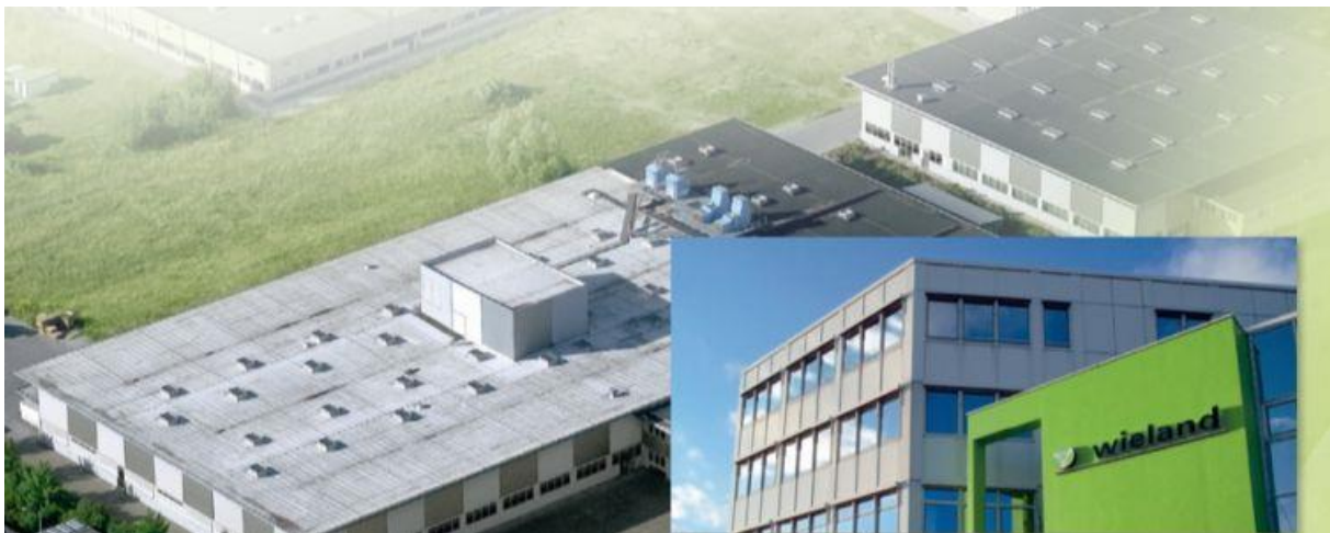
Hauptstammsitz der oberfränkischen Unternehmensholding Wieland Electric in Bamberg

Sichere elektrische Verbindungen bilden den Mittelpunkt des Produktprogramms – seit Bestehen des Unternehmens. Genauso wichtig sind Wieland gute Kontakte von Mensch zu Mensch: bei Kundenbeziehungen genauso wie beim Miteinander innerhalb des Unternehmens.