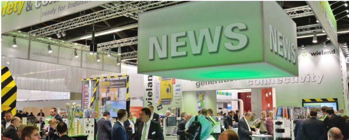
Messestand der Wieland-Holding 2017